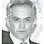
Miguel Ángel Mancera, jefe de Gobierno de la CDMX.

Los trabajadores del Gobierno de la Ciudad de México trabajarán en casa al menos un día a la semana con el objetivo de reducir la contaminación ambiental y mejorar la movilidad en la capital del país, adelantó el jefe de Gobierno, Miguel Ángel Mancera.