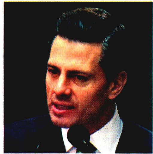
El presidente Enrique Peña Nieto afirmó que habrá una respuesta a cada medida que tome EU.

Al respecto, el gobierno mexicano, en voz del secretario de Relaciones Exteriores, Luis Videgaray, advirtió que si este despliegue se traduce en una militarización de los límites entre ambas naciones, “ello dañaría gravemente la relación bilateral”.