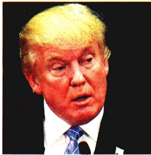
Trump justificó el despliegue militar por “el des-gobierno que persiste” en la frontera común.

En un nuevo hecho que genera tensión entre los gobiernos de México y Estados Unidos, Donald Trump firmó ayer una proclama para que la Guardia Nacional vigile la frontera sur de su país, con el objetivo de combatir la inmigración ilegal. “El desgobierno que persiste en nuestra frontera sur es fundamentalmente incompatible con la protección, la seguridad y la soberanía del pueblo estadounidense”, sostuvo el mandatario en el memorándum en el que autorizó la medida.