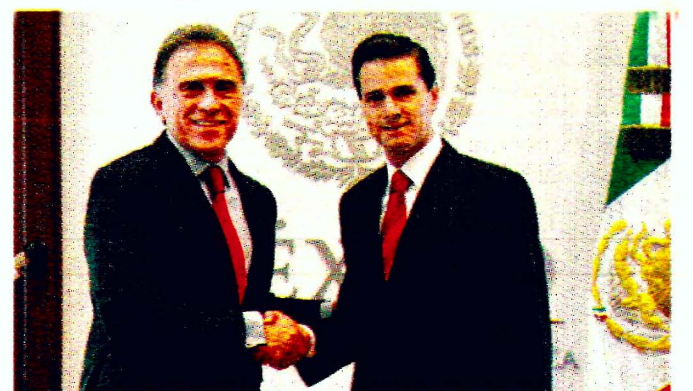
El presidente Enrique Peña Nieto recibió ayer a los gobernadores electos de Veracruz, Oaxaca y Tlaxcala, Miguel Ángel Yunes Linares, Alejandro Murat y Marco Antonio Mena, respectivamente.

Luego de su encuentro con el presidente Enrique Peña Nieto, en Los Pinos, el veracruzano dijo que encontró completa disposición y respaldo del mandatario federal. Sobre el proceso de