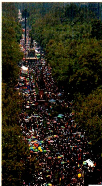
Alrededor de 170 mil personas acudieron ayer a la marcha.

A pesar de que el ambiente en las calles capitalinas era de fiesta, no todo fue celebración, puesto que los asistentes al desfile reclamaron a las autoridades la falta de