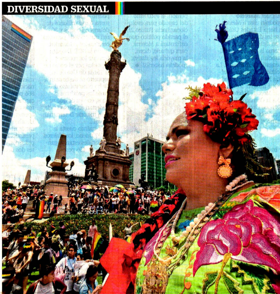
La comunidad muxe viajó 720 kilómetros desde Juchitán, Oaxaca, para participar en la 41 Marcha del Orgullo LGBTTTI en la Ciudad de México. Desde hace 10 años, el contingente indígena no acudía a la celebración.