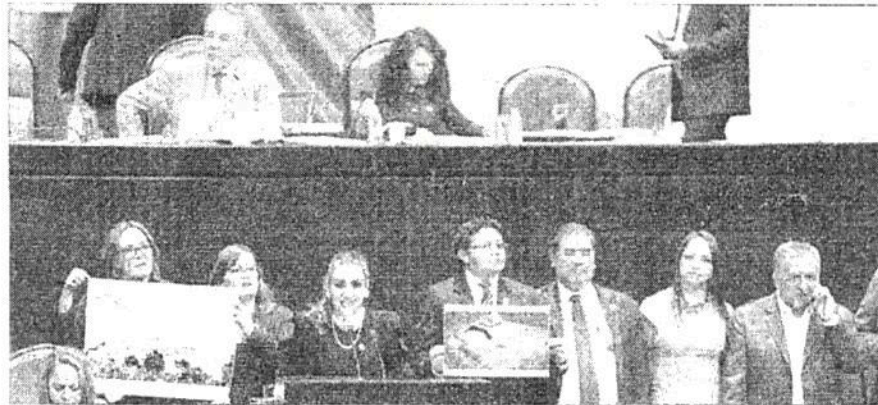
▲ Diputados de Morena demandaron en la sesión de ayer en San Lázaro que la Gran Pirámide de Cholula y el Santuario de los