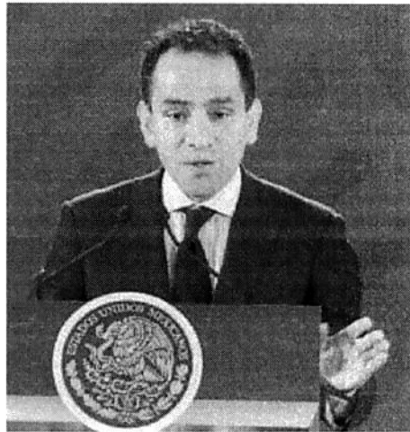
Arturo Herrera, subsecretario de Hacienda.

Sin contar que tanto el Presidente como la secretaria de Energía han descalificado a las calificadoras, Pemex ya no aguanta otro ridículo internacional. Es la última llamada para el gobierno. Si la Cuarta Transformación quiere llevar a cabo un verdadero rescate de la principal empresa mexicana, más vale que se impongan las visiones de mercado, sensatas, de Arturo Herrera, un prestigiado economista del Colegio de México y doctor por la Universidad de Nueva York, quien ha trabajado para el Banco Mundial desde 2010, y no de los rebeldes del gabinete. ●