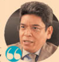
Adolfo Cuevas, PRESIDENTE INTERINO IFT.

En la medida en que haya más competencia, (el sector) se vuelve más competitivo y ayuda a que la economía sea más competitiva".