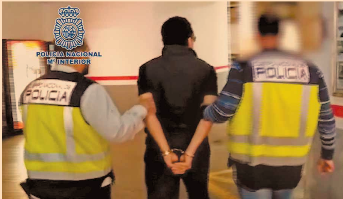
Bajo arresto. Policías españoles conducen a una cárcel al exdirector de Pemex, en Málaga, España.