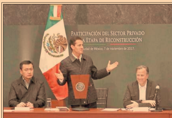
Peña Nieto dijo que no se mezclan los recursos del gobierno y de la IP para la reconstrucción. P52

Catorce de los 32 estados del país colocan 70% o más de su producción destinada a exportar en el mercado de Estados Unidos, lo cual los hace vulnerables en caso de que la renegociación del TLCAN entre México, Canadá y Estados Unidos no rindiera frutos y se cancelara. De los 14 estados involucrados, la mitad tiene un alto grado de competitividad y el resto tiene un nivel medio o bajo, de acuerdo con un estudio de aregional.