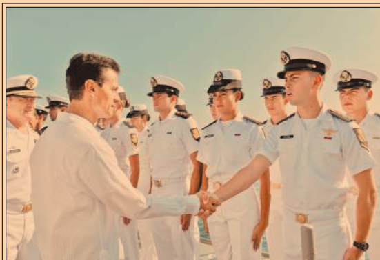
En Alvarado, Veracruz, EPN refrendó el papel de las Fuerzas Armadas en tareas de seguridad. P41