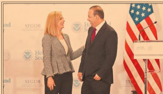
KIRSTJEN NIELSEN, de Seguridad Interna de EU, se reunió con Alfonso Navarrete, de Segob. P53

EU concede hasta el 1 de mayo para negociar exenciones de aranceles a acero y aluminio. P27