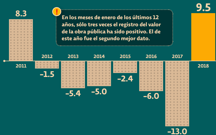
Valor de producción del sector público (VARIACIÓN ANUAL REAL %-ENERO DE CADA AÑO)

Tras seis años con arranques negativos en obra pública, en el primer mes del 2018 el registro fue positivo. Destacan los subsectores de carreteras, obras de transporte en ciudades, edificios e infraestructura eléctrica, de acuerdo con el Inegi. P4-5