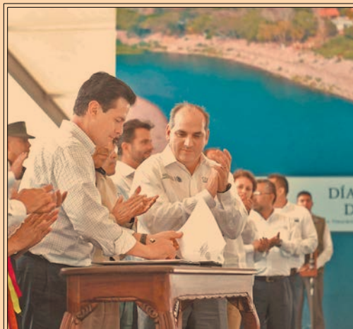
ENRIQUE PEÑA NIETO, PRESIDENTE DE MÉXICO

18.55 PESOS POR DÓLAR cerró ayer el tipo de cambio, con una baja de 0.43% del peso. 3.20% CAYÓ la Bolsa de Shanghai en la apertura de ayer, tras conocerse los aranceles. 3.60% PERDIÓ el índice bursátil Nikkei, de Japón, al inicio de la jornada de ayer.