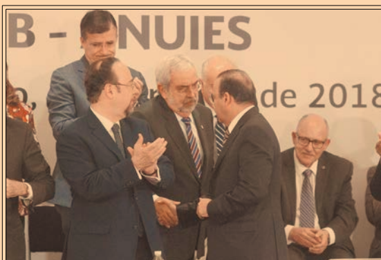
SEGOB y la ANUIES firmaron un convenio para elevar la seguridad en universidades. P40-41

52.9% DEL TOTAL de la turbosina que se vendió en el país en el 2017 fue importada.