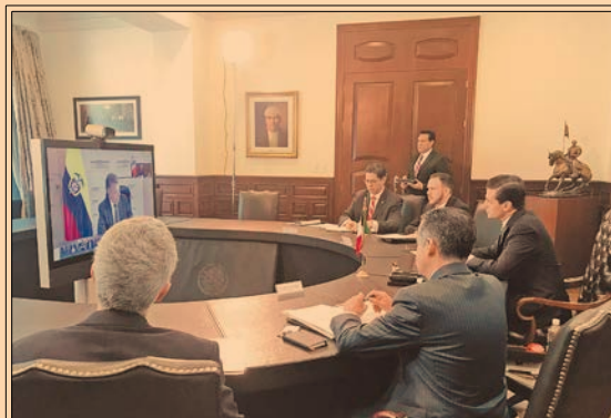
EPN PARTICIPÓ en una cumbre virtual con los integrantes de la Alianza del Pacífico. P33

“México y Canadá le compran más acero a EU del que le venden. EU se daría un balazo en el pie si no los excluye del arancel a la importación de ese metal”.