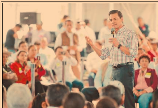
El presidente Enrique Peña Nieto supervisó los trabajos de reconstrucción en Puebla. P47

7% de lo pagado fue para saneamiento financiero federal