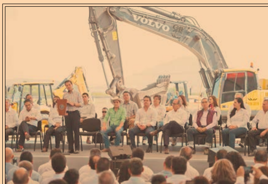
EL PRESIDENTE Peña Nieto hizo entrega de infraestructura carretera en Michoacán. P76-77