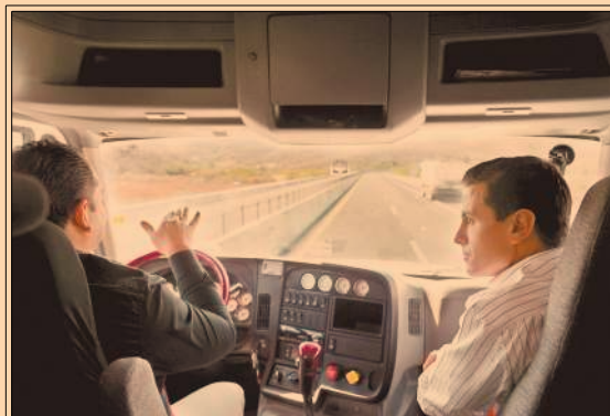
EL PRESIDENTE EPN entregó la primera etapa de la autopista Jala-Compostela, en Nayarit. P34