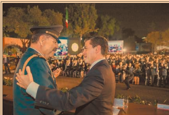
PEÑA NIETO encabezó el acto del Día del Estado Mayor Presidencial. eleconomista.mx

Manuel Barreiro, el presunto lavador de dinero para R. Anaya, fue ubicado en Canadá; tramitó amparo. P49