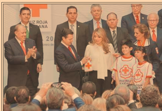
EPN PUSO en marcha la colecta de la Cruz Roja 2018 y aplaudió su labor tras los sismos. P49