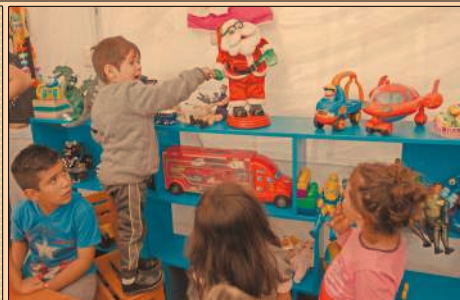
Pese a no tener techo, niños damnificados del multifamiliar de Tlalpan recibieron juguetes esta Navidad.

38% de las casas afectadas está en Oaxaca; suman 369 fallecidos a causa del desastre