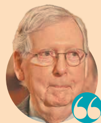
Mitch McConnell, LÍDER DE LOS REPUBLICANOS EN EL SENADO DE EU.

• Podría ser avalado esta semana luego de que el Senado de EU aplazó el inicio del impeachment a Trump.