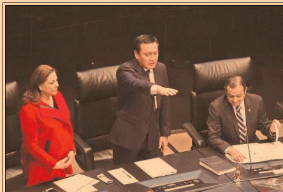
Osorio Chong planteó un modelo de seguridad que nivele instituciones locales y federales. P43