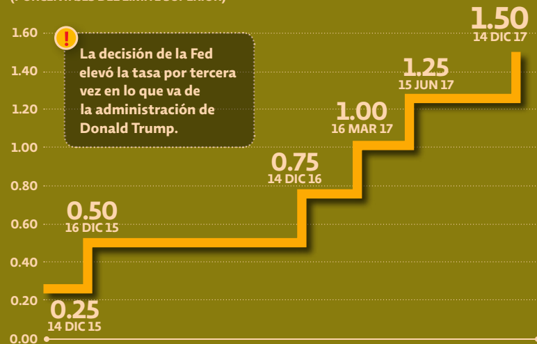
Tasa de interés de la Reserva Federal de Estados Unidos (PORCENTAJES DEL LÍMITE SUPERIOR)

El Comité Federal de Mercado Abierto de la Fed elevó ayer la tasa referencial en 25 puntos base, para ubicarla en 1.5 por ciento. Es la tercera vez que toma la decisión y la sube en lo que va del año. El tipo de cambio resintió el anuncio con una depreciación para el peso. P4-5