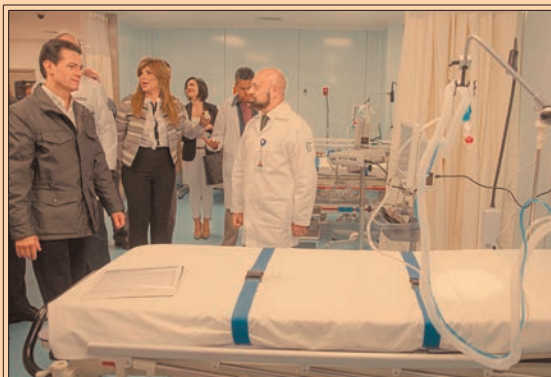
PEÑA NIETO entregó el Hospital General de zona número 5 del IMSS, en Nogales, Sonora. P33

10.9% al año ha crecido el arribo de paseantes