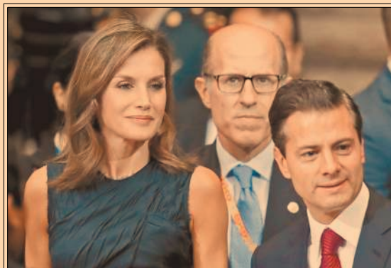
El presidente Peña Nieto hizo un exhorto a redoblar la lucha contra el cáncer en el país. P60

3.7 millones de personas se hallan subocupadas.