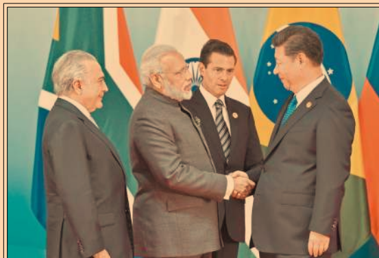
Inicia la reunión BRICS. Xi Jinping exhortó a construir una nueva economía mundial. P5 Y 40

15 contratos de exploración y extracción ha solicitado Pemex que sean migrados.