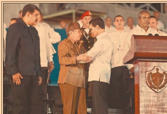
Peña Nieto dio las condolencias al pueblo cubano por la muerte del expresidente Castro. P62

El valor de las acciones de OHL ha caído 53.02% en España y en México 4.16% en lo que va del año. TEP10