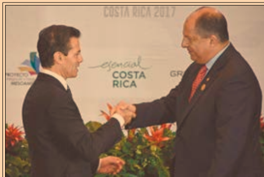
Enrique Peña Nieto destacó en Costa Rica que en la agenda de los países de la región el tema prioritario debe ser la migración. P47

25-50 puntos base podría elevar Banxico la tasa.