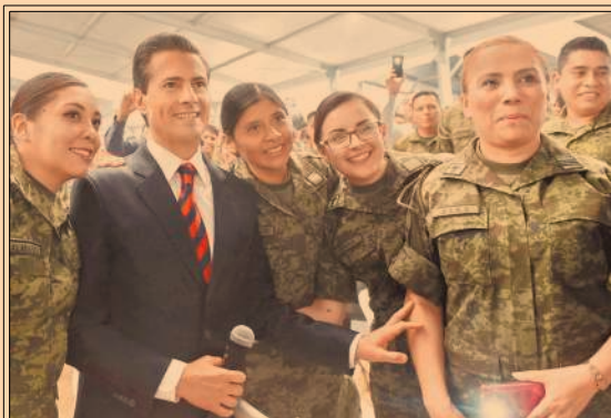
El presidente Enrique Peña Nieto respaldó a las Fuerzas Armadas ante 30,000 efectivos. P47