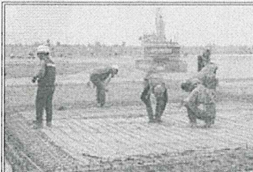
En el segundo semestre del año se construirán tres pistas y el edificio terminal del NAICM. P31

Capturan en Oaxaca al Rey Midas; está acusado de lavado de dinero para el cártel del Chapo Guzmán. P43