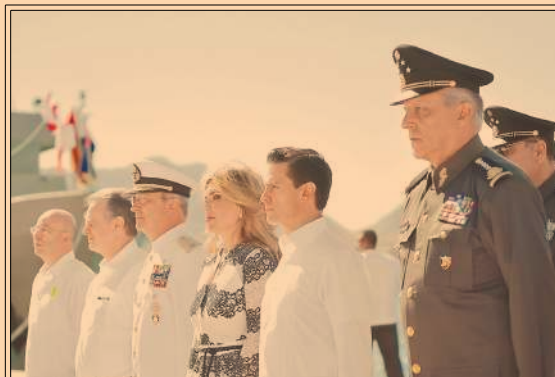
El presidente Enrique Peña Nieto encabezó los festejos por el Día de la Armada en Sonora. P44