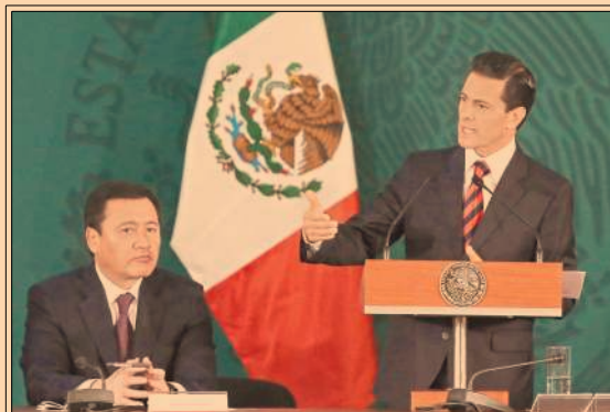
Enrique Peña Nieto se pronunció a favor de rediseñar el modelo policial del país.