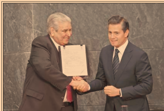
La aprehensión de exgobernadores, contundente mensaje contra la impunidad, dijo EPN. P24 Y 39