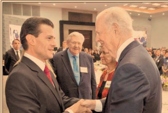
El presidente Enrique Peña Nieto recibió en Los Pinos a los integrantes del Centro Paley. P25

6.15 bdp es el valor de capitalización del IPC de la Bolsa mexicana.