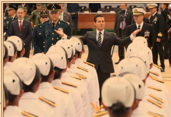
EPN inauguró la Escuela Militar de Enfermeras y reconoció la labor de las Fuerzas Armadas. P36

El reclamo por desaparición de alumnos de la normal de Ayotzinapa debe ser a Fuerzas Armadas: AMLO. P41