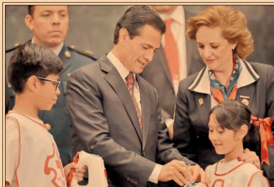
El presidente Enrique Peña Nieto encabezó el inicio de la Colecta Nacional Cruz Roja 2017. P47

Reconoce Osorio Chong a policías federales entregándoles créditos hipotecarios y personales. P50