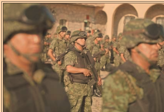
Las Fuerzas Armadas tienen apoyo, pero falta legislar el marco jurídico de su actividad. P50-51

2.174 millones de barriles diarios produjo México en el 2016.