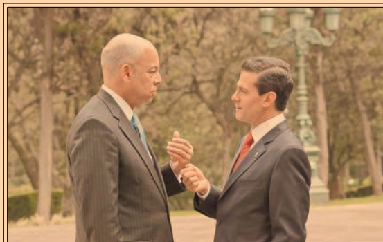
El secretario de Seguridad Interna de EU, Jeh Johnson, se reunió en México con EPN, Osorio Chong y Claudia Ruiz Massieu.