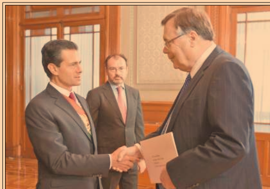
El presidente Peña Nieto recibió cartas credenciales de 15 embajadores.