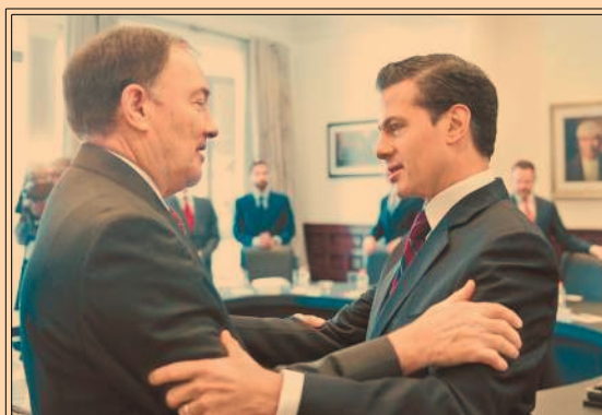
EPN recibió en Los Pinos al gobernador de Utah, EU, Gary Herbert. Ambos respaldaron el TLCAN. P21

Entidades recibieron menos transferencia de recursos al inicio del año; gasto federalizado cayó 1.7% a febrero. P32