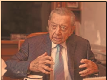
Miguel Alemán Velasco, presidente de México Cumbre de Negocios.