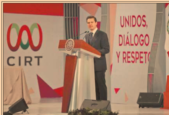
El presidente EPN asistió a la reunión por la 58 Semana Nacional de Radio y Televisión. P34

La SCJN rechazó por mayoría de votos el proyecto de derecho de réplica, presentado por Morena, PRD y la CNDH. P56