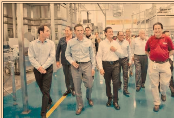
Enrique Peña Nieto inauguró ayer la nueva planta de la embotelladora Peñafiel en Tecamac. P24