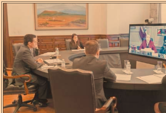
Enrique Peña Nieto sostuvo un encuentro virtual con sus homólogos de la Alianza del Pacífico. P32

Seis empresas mexicanas invirtieron 693 millones de dólares en Colombia durante el 2016. P32