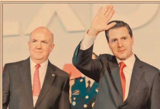
Al inaugurar la Expo ANTAD, EPN informó la creación de 154,000 plazas laborales en febrero. P32

De acuerdo con el IIF, México está entre los mercados emergentes con mayor salida de capitales. P8