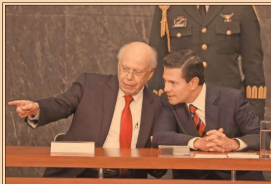
Peña Nieto (D) y José Narro, en el Premio Nacional de Acción Voluntaria y Solidaria. P55

La incertidumbre generada por la volatilidad en el tipo de cambio y otros factores de la economía e incluso de índole política no frenaron la inercia de la industria automotriz, que tras los resultados de noviembre prevé superar sus expectativas al cierre del año en producción y ventas de autos a mercados extranjeros, mientras las ventas en el mercado local también son elevadas. P28