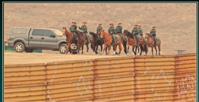
Acción conjunta. Vigilancia en la frontera se agudizará.

Apoyarán a la Patrulla Fronteriza contra la inmigración ilegal. Gobernadores sureños aplaudieron la medida. P41