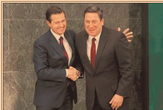
EL NUEVO titular de la Sagarpa, Baltazar Hinojosa Ochoa, rindió protesta ante Peña Nieto. P24

LUIS VIDEGARAY, SRIO. DE RELACIONES EXTERIORES “NO PORTARÁN ARMAS NI HARÁN LABOR DE CONTROL MIGRATORIO”