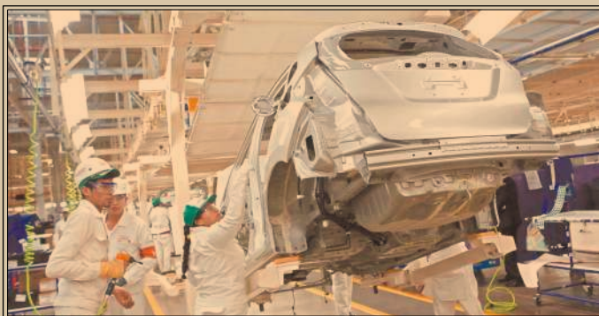
Reglas de origen automotrices, tema central.

Las representaciones harán reuniones bilaterales y luego una trilateral entre los ministros de EU, Canadá y México. P18-19