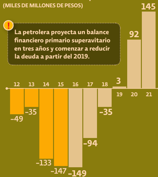
Pemex: balance financiero primario* (MILES DE MILLONES DE PESOS)

La petrolera proyecta un balance financiero primario superavitario en tres años y comenzar a reducir la deuda a partir del 2019.