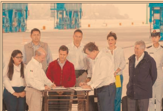
Peña Nieto inauguró la ampliación del puerto de Tuxpan, que cuadruplicará su capacidad. P39

LA CNH ANUNCIA QUE EN LO QUE RESTA DEL SEXENIO HARÁ TRES NUEVAS RONDAS DE LICITACIÓN DE CAMPOS PETROLEROS P27