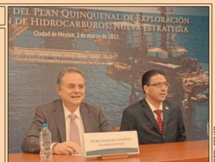
DEL PLAN QUINQUENAL DE EXPLORACIÓN DE HIDROCARBUROS: NUEVA ESTRATEGIA Ciudad de México, 2 de marzo de 2017.