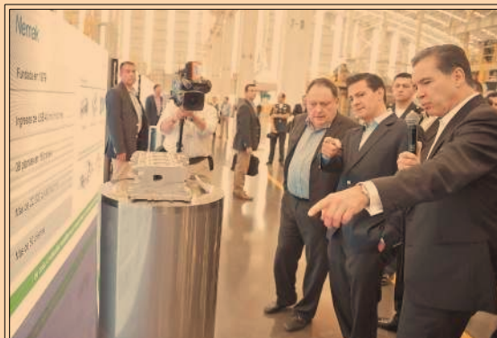
Peña Nieto inauguró una central eléctrica en Pesquería y una fundidora en García, NL. P25

En marzo, las tarifas eléctricas de la CFE a industriales y comerciales aumentaron entre 8 y 17.2 por ciento. P24